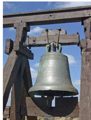
Glocke auf Burg Greifenstein

„Eintracht“-Sänger erreichen gestecktes Ziel mühelos