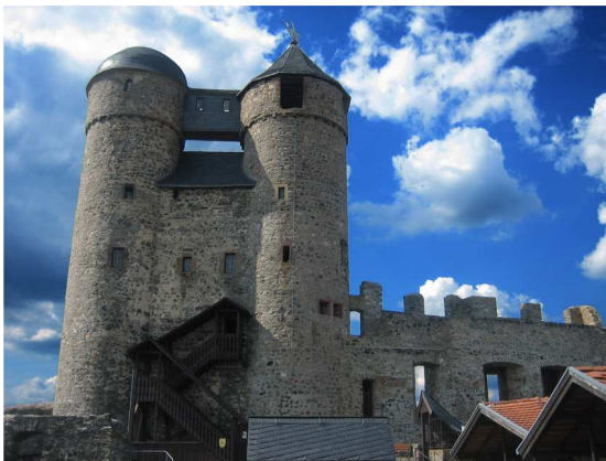
Kennzeichen von Burg Greifenstein ist der Doppelturm