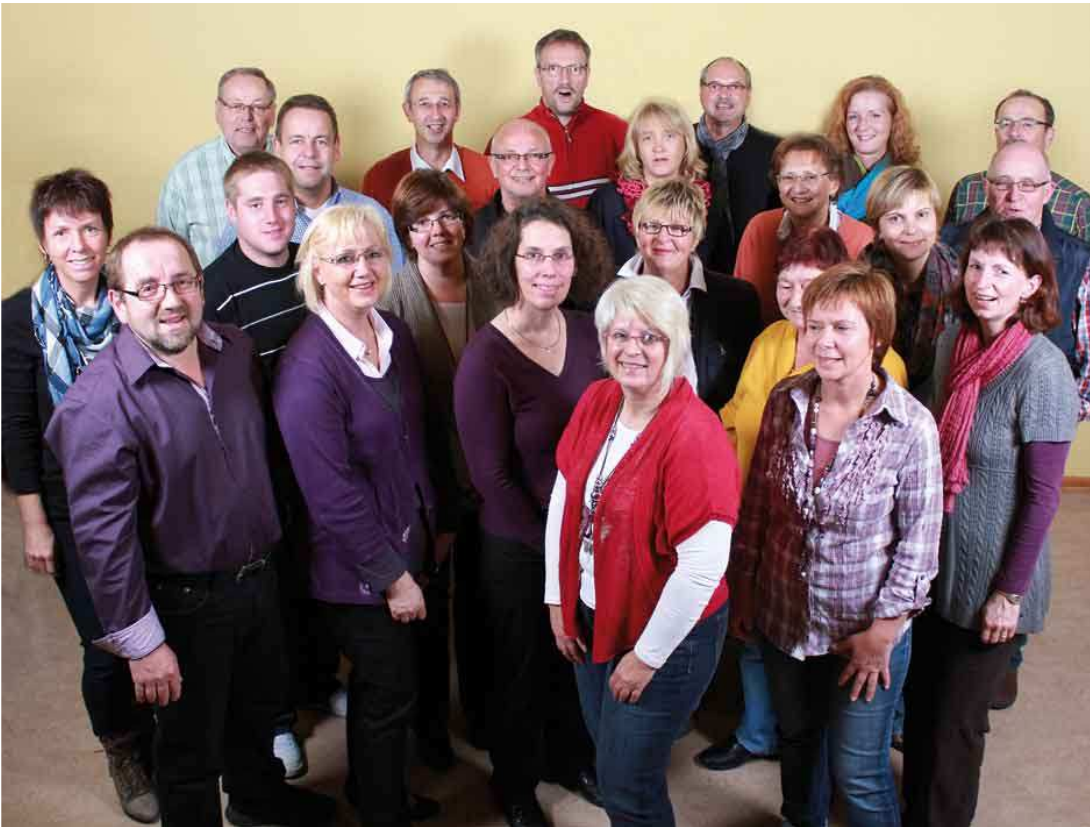
Die ersten mitwirkenden Mitsängerinnen und Sänger Stand 11. Oktober 2012

Und das wird sich nicht nur auf Männerchor beschränken. Hierzu werden wir, wie bereits angekündigt, einen Projektchor gründen. Zahlreiche Sängerinnen des Frauenchor „Gospel & More“ haben bereits ihre Mitwirkung signalisiert. Gemeinsam mit Sängern der Eintracht wird der Chor modernen und poppigen Chorgesang darbieten, also sicherlich etwas, was viele ansprechen sollte.