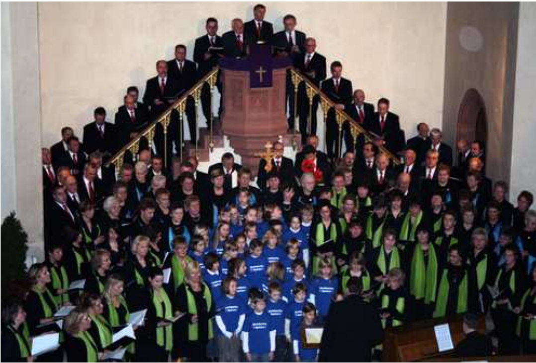
Alle Chöre stimmen zum Abschluss »Da wird Weihnacht« an