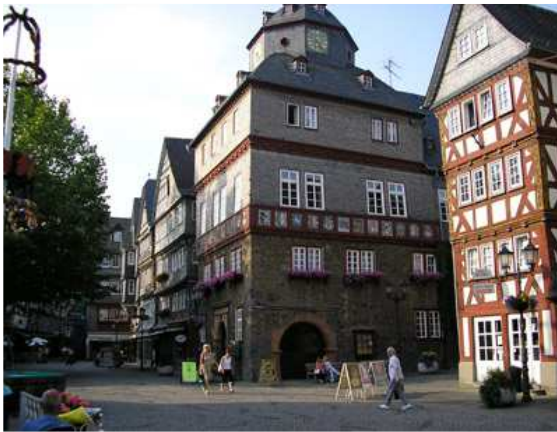
Marktplatz Rathaus Herborn

mit netten Anekdoten über das Leben in den Fachwerkhäusern, den Handel und den Reichtum der Stadt an der Dill. Nach einer Stärkung in den Kaffeehäusern der Stadt war die Burg Greifenstein das weitere Ziel. Ein Aufstieg in die Doppeltürme des Bergfriedes oder der Blick in die Tiefen der Kasematten lohnten der Mühe. Auch fand der Chor sich zum Ansingen des Sancta Maria in der mit Putten reich verzierten Barockkirche ein. In einem Geschützturm der Burg ist das Deutsche Glockenmuseum untergebracht. Hier probierten die Besucher die großen und schweren Glocken lautstark zum schwingen bringen. Den Abschluss des Tages verbrachten die etwa 70 Ausflügler „Beim Philipp“ in Leihgestern. Nach dem reichhaltigen Abendessen lud die Kapelle Weil zum Tanz. Schunkeln und die Gesangsvorträge des Chores steigerten die Fröhlichkeit. Wer mit dem ersten Bus gegen 22 Uhr die Heimreise antrat hatte sicherlich einen schönen Tag verbracht. Eine zweite Gruppe erreichte Steinbach erst um 24 Uhr. Es hätte ja noch später werden können, denn mit noch schnellerem Takt der Musik erhöhte sich die Stimmung, der Tanzschweiß floss in Strömen und die Lachmuskeln wurden mit der Muppetshow schon arg strapaziert. Ein guter Tag, der in Erinnerung bleibt.